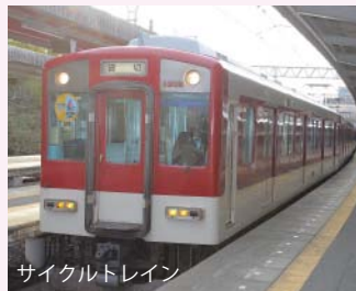
サイクルトレイン